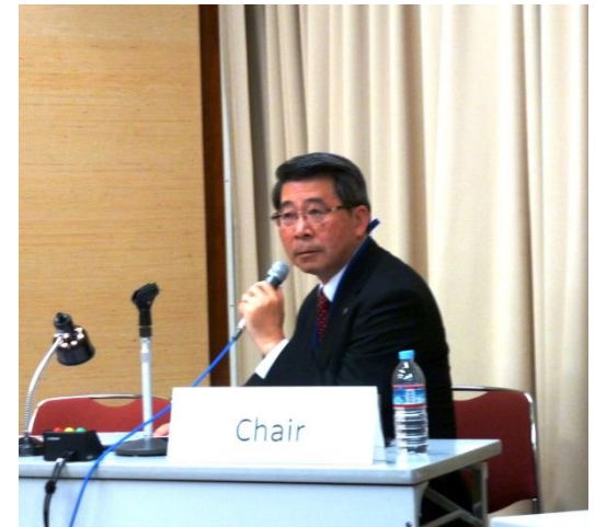
「水と環境」セクションで 議長役を務める