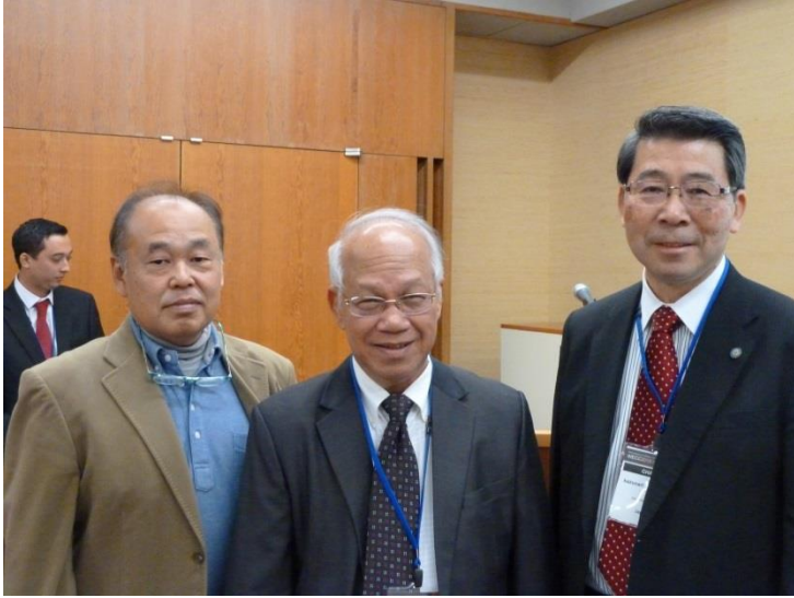
Someth Uk (カンボジア)