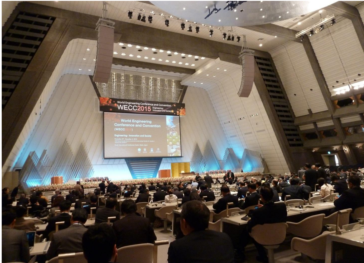
京都国際会館 大ホール