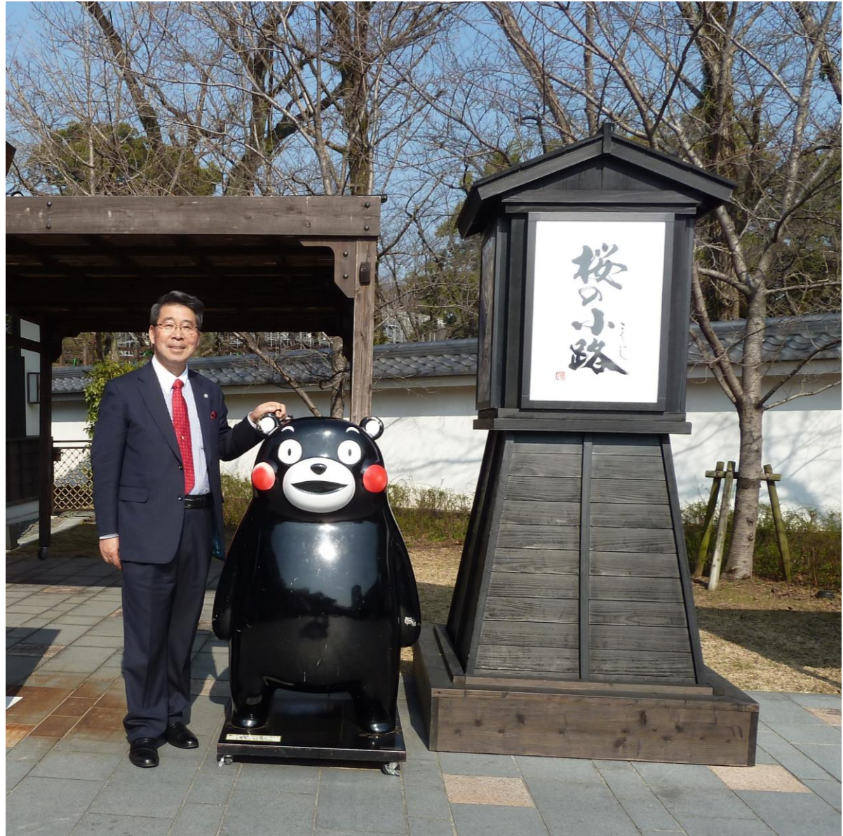
くまモン（2010年より熊本県の公式マスコット）