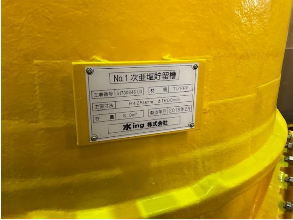
2018年 2月 水ing 納入