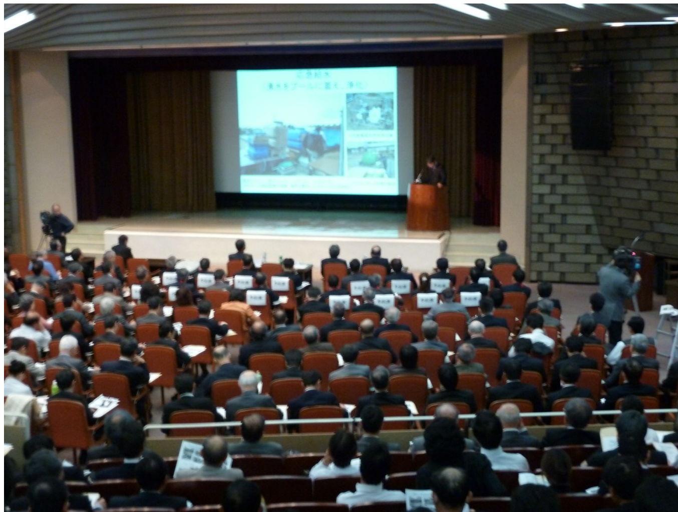
大阪商工会議所・国際会議ホール（参加者521名）NHKも取材